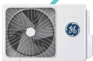
GE Appliances (unità esterna)

GAMMA MULTISPLIT PRIME+: unità da 2,5 kW e 3,5 kW